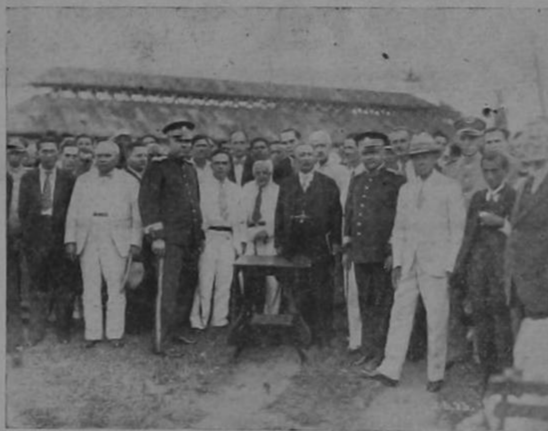
Autoridades Municipales, Cuerpo Consular y vecinos del Puerto en el imponente momento de la ceremonia